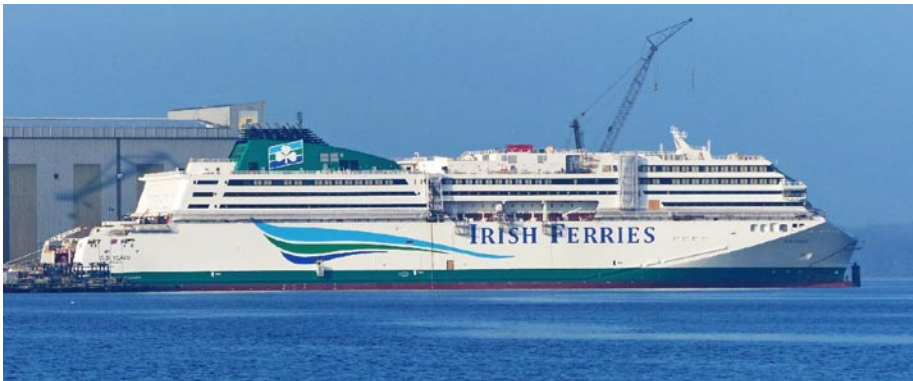
Die „W.B. Yeats“ ist der bisher größte Fährschiffsneubau der Flensburger Werft FSG