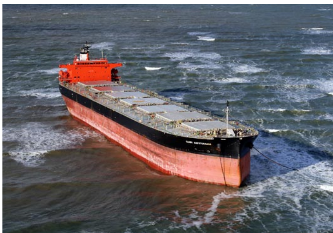
Die „Glory Amsterdam“ - gestrandet vor der Insel Langeoog

Zur Strandung der „Glory Amsterdam“ vor Langeoog weist der Arbeitskreis (AK) Recht im Ständigen Fachausschuss (StFA) des DNV auf folgende Gesichtspunkte hin: Innerhalb des Küstenmeeres und auch in der Ausschließlichen Wirtschaftszone (AWZ) haben die zuständigen Behörden die notwendigen Rechtsgrundlagen zur Gefahrenabwehr, die sie nach pflichtgemäßem Ermessen anwenden. Dies beinhaltet die Möglichkeit, Verfügungen zu erlassen, beispielsweise die Verpflichtung, Schlepperhilfe zu nutzen und die Durchsetzung der Verfügungen in Form der Ersatzvornahme, des Sofortvollzugs oder des unmittelbaren Zwangs nach dem Verwaltungsvollstreckengesetz des Bundes beziehungsweise dem Seeaufgabengesetz zu veranlassen, beispielsweise die Entsendung eines Boarding-Teams zur Herstellung einer Schleppverbindung. Daneben gibt es auch die Möglichkeit der Ersatzvornahme im Wege der zivilrechtlichen Geschäftsführung ohne Auftrag. Sollte also der Kapitän eines havarierten Schiffes, das eine Gefahr darstellt, nicht bereit sein, Schlepperhilfe anzunehmen, könnte dies auch ohne Einwilligung des Kapitäns durch die Behörde veranlasst werden. Die Beurteilung der Frage, ob seitens der Schiffsführung eine etwaige Ablehnung, ein Einschätzungsfehler, Defizite der Handlungskompetenz oder in der Kommunikation vorliegen, obliegt den Behörden im Rahmen ihres pflichtgemäßen Ermessens. Die Überprüfung der Rechtmäßigkeit obliegt dem verwaltungs- oder zivilgerichtlichen Rechtsschutz.