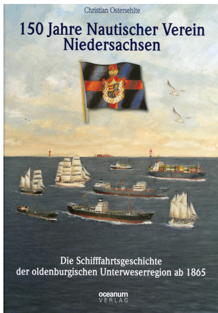
Titel des Jubiläumsbuchs, das im Oceanum Verlag, Wiefelstede, erschienen ist. ISBN 978-3-86927-405-8